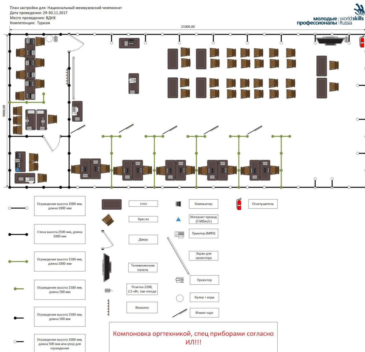
Схема конкурсной площадки